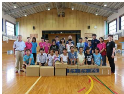
支援品の前で JRC のメンバーと記念撮影