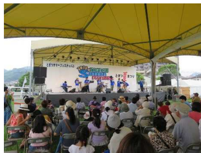
ステージイベント（とぎつ音楽団）

ステージでは、午後2時から「タムタムスタンプ17周年記念祭」（ビンゴ大会）を皮切りに「とぎつ音楽団オンステージ」などのイベントが繰り広げられました。