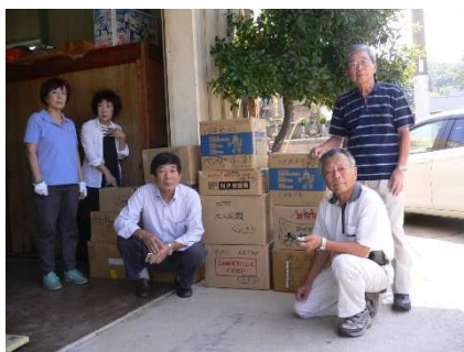
梱包が終わり 郵送品の前で記念撮影

9 月 18 日（金）午前 11 時から浜田郷の当法人の事務所で、カンボジア支援物資の梱包（こ