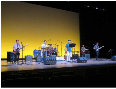
「はあとんぷ」の演奏風景