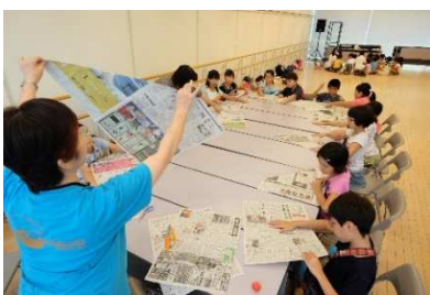
昔懐かし 新聞紙の兜(カブト)づくり

8月8日(土)、とぎつカナリーホールで、児童58人(3人欠席)とスタッフ13人(うち大学生8人)が参加して「第4回とぎつサタデールーム」を開催しました。