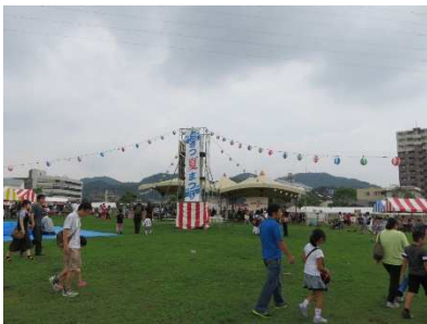
夏まつり 芝生広場会場