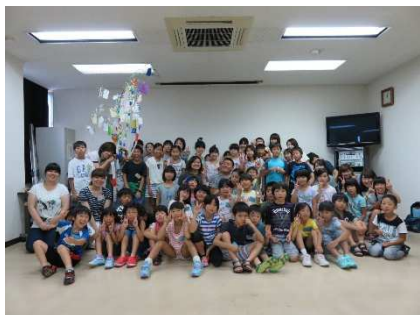
アメリカの留学生2人を中央に集合写真

7月11日(土)、時津公民館の集会会議室と研修室で、児童55人(6人欠席)とスタッフ16人(うち大学生13人)が参加して「第3回とぎつサタデールーム」を開催しました。